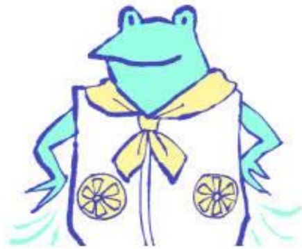
ファン付きウェア、 ネッククーラー