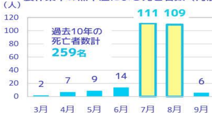
農作業中の熱中症による死亡者数（月別）